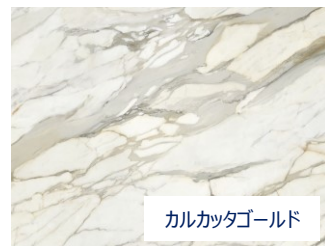
カルカッタゴールド