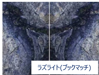
ラズライト(ブクマッチ)

アズールマカウバ (ブラジル産の青い大理石) 薄いブルーと淡いグレーが波のように大きく流れる紋様で、 大判にすることでその美しさが一層映えます ＜複合板サイズ W3000mm x H2000mm (縦に3分割) 厚み20mm (石6mm+ABSハニカム14mm) 重量約130kg＞