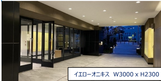
イエローオニキス W3000 x H2300 x t20 など