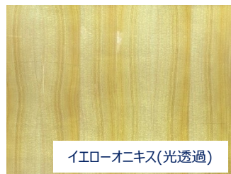
イエローオニキス(光透過)