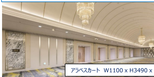
アラベスカート W1100 x H3490 x t20 など