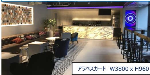
アラベスカート W3800 x H960 x t15 など