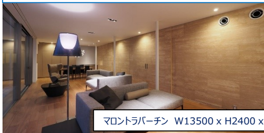
マントラパーチン W13500 x H2400 x t3.5 壁面