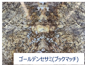
ゴールデンセサミ(ブクマッチ)